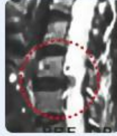
صورة الرنين المغناطيسي قبل العملية اعوجاج العصب العنقي