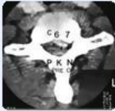
صورة لأشعة مقطعية قبل العملية قطعة من حطام غضروف الرقبة المنزلق بشكل مائل