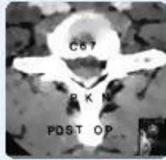
صورة الأشعة المقطعية بعد العملية العضروف بين الفقرى في وضع أفقي طبيعي