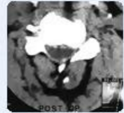
صورة الأشعة المقطعية بعد العملية تناسق الحبل الشوكي بشكل طبيعي