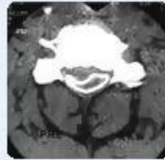
صورة الأشعة المقطعية قبل العملية يشبه الحبل الشوكي قرص العجة المنبعج