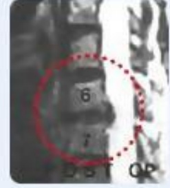
صورة أشعة الرنين المغناطيسي بعد العملية تم تصحيح وضع العصب العنقي بشكل شبه تام واحتفى الألم بشكل فوري داخل غرفة العمليات.