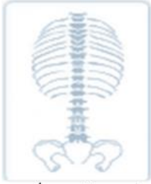
عمود فقري طبيعي

أن الجنف (ميلان جانبي في العمود الفقري) حالة يميل فيه العمود الفقري إلى الجنب، والذي ما يصاحبه عادةً الميل إلى الجنب أو الدوران بشكل غير طبيعي مما يؤدي إلى مظهر غير جيد. يبدو المرضى الذين يعانون من الجنف أقصر من طولهم الحقيقي لانتواء العمود الفقري. إضافة إلى ذلك، قد يحدث ألم وعدم راحة أسفل الظهر والظهر والكتفين، لذلك فإنه من الضروري القيام بالتشخيص الصحيح والدقيق وتقديم العلاج المطلوب. في حالة الجنف التنكسي، قد يترافق ذلك مع تشوه في الفقرات المرتبط بضيق قناة العمود الفقري وهو ما يصاحبه ألم شديد في الأطراف السفلية وصعوبة في المشي.